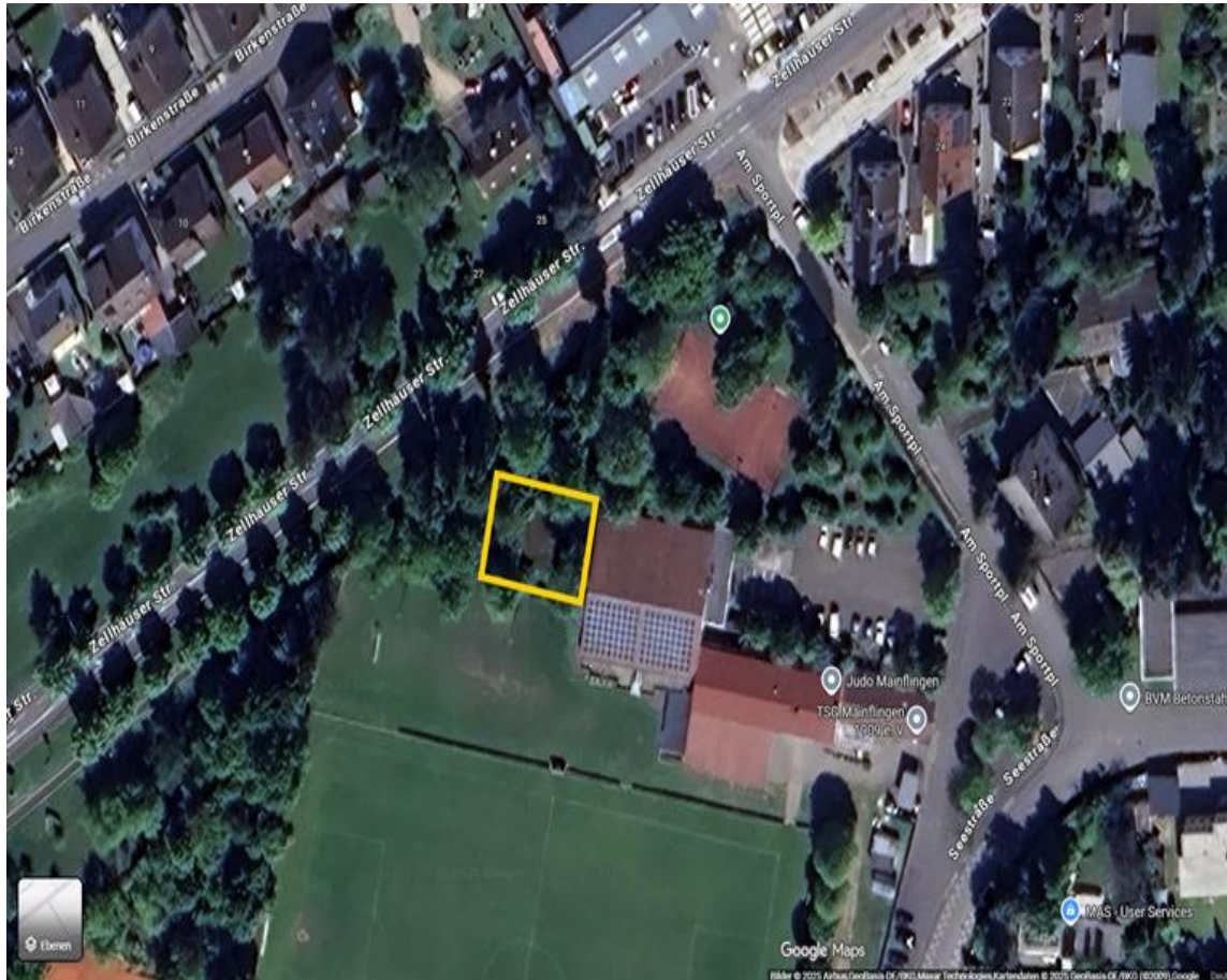
Auszug aus Google Maps – Standort des in Frage kommenden Bereiches